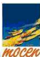
BEAU Maguy - MOCEN