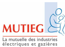
PELOUARD Marc - MUTIEG