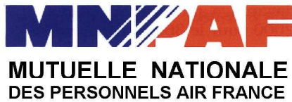
BOO Vincent - MUTUELLE NATIONALE DES PERSONNELS AIR France