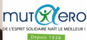
ALBINET Jean-Claude - MUTUELLE AEROSPATIALE TOULOUSE