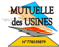
GARROT Yves - MUTUELLE DES USINES